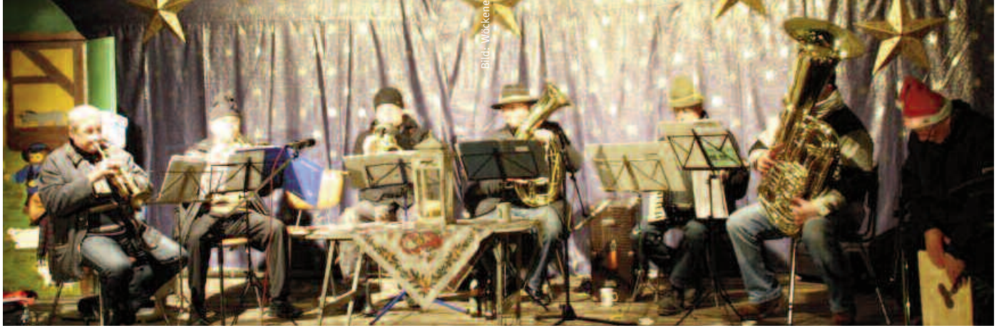
Ein buntes Programm gibt auf den Weihnachtsmärkten: hier Musik auf der Bühne in Weißenstadt

Öffnung der Budenstadt 14.00 Uhr Grundschulchor 15.30 Uhr Posaunenchor Großwendern 17.45 Uhr Aufführung des Kinderhortes Kunterbunt 18.00 Uhr Nikolaus und Christkind kommen; anschl. Ziehung der Gewinner des Weihnachtsrätsels