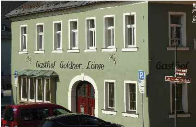
Revitalisierung „Goldner Löwe“ – noch mehr Leben in die Stadtmitte