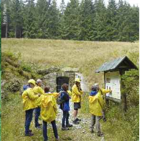
Spannende Führungen sind nun wieder möglich im Besucherbergwerk „Zinnerzgrube Werra“