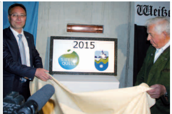
Plan: Gesell GmbH; Foto: Plaum; Logo: designhouse®