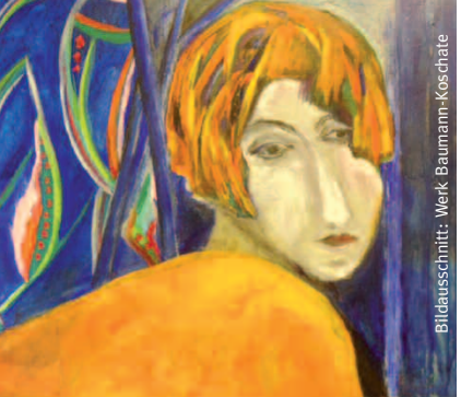
Bildausschnitt: Werk Baumann-Koschate