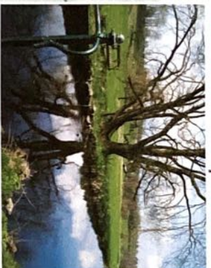
Blick auf die Eger bei Lehrpfad-Station 1.