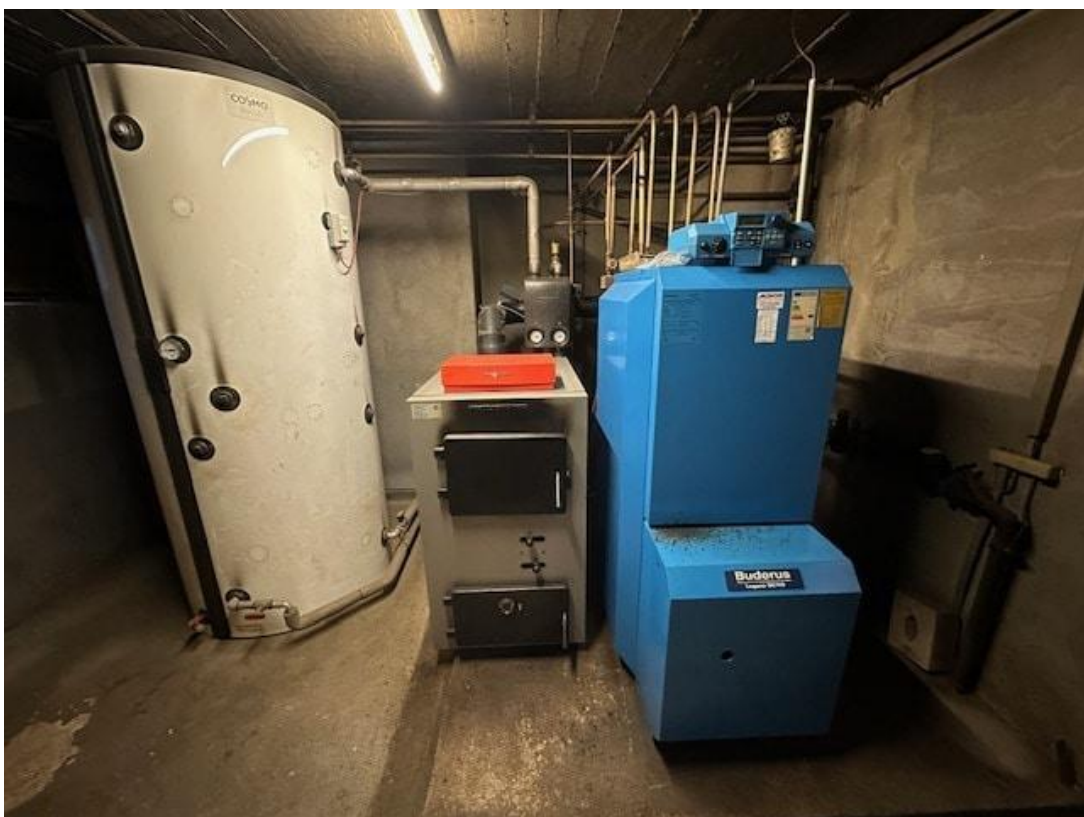
KG_Heizung Holz BJ2014 + Öl